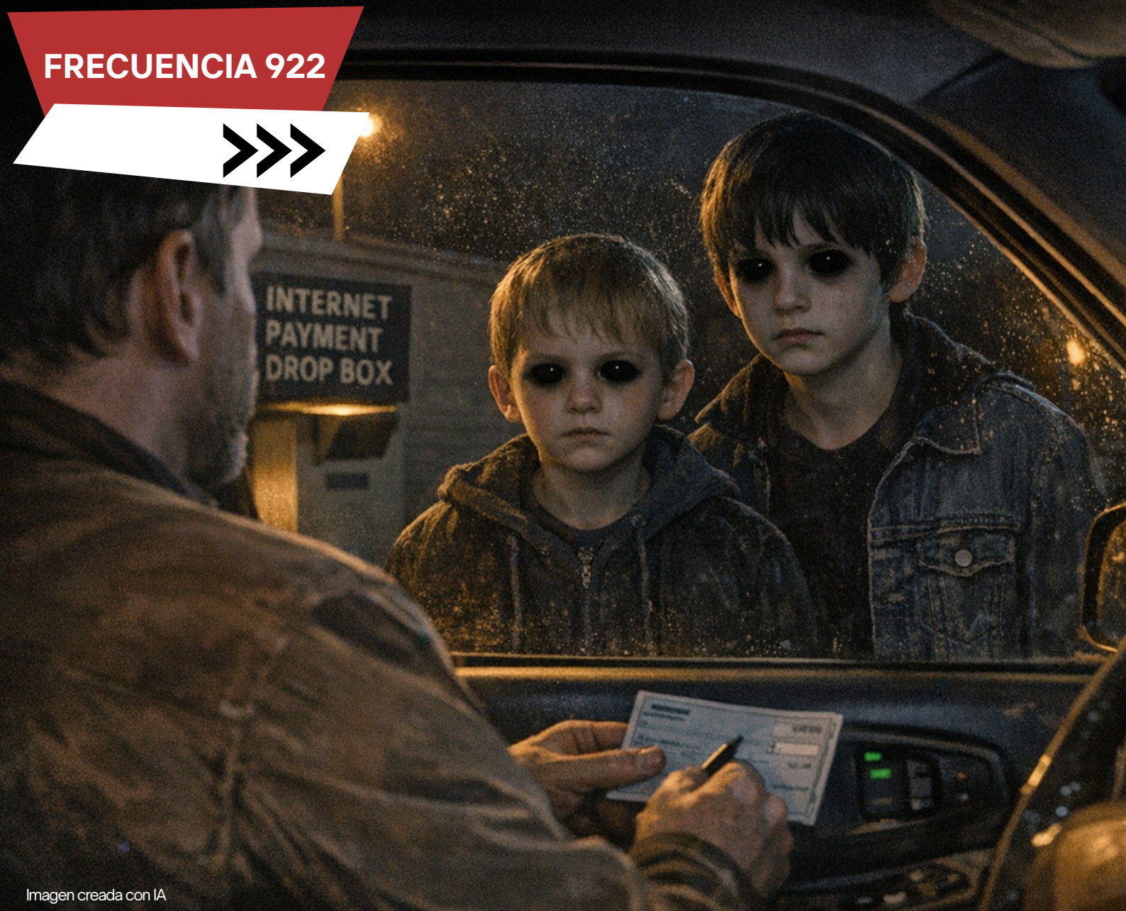
Imagen creada con IA